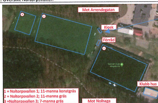
2. Översikt Noltorpsvallen

Att ha tillgång till toalett på nära håll är viktigt för verksamheten då längre avbrott stör träningarna samt då snabbt behov uppkommer i de lägre åldrarna vill vi få en toalett på plats innan säsongen 2026. Nuvarande närmaste toalett finns i vårt klubbhus ca 220m bort både för publik och medlemmar.